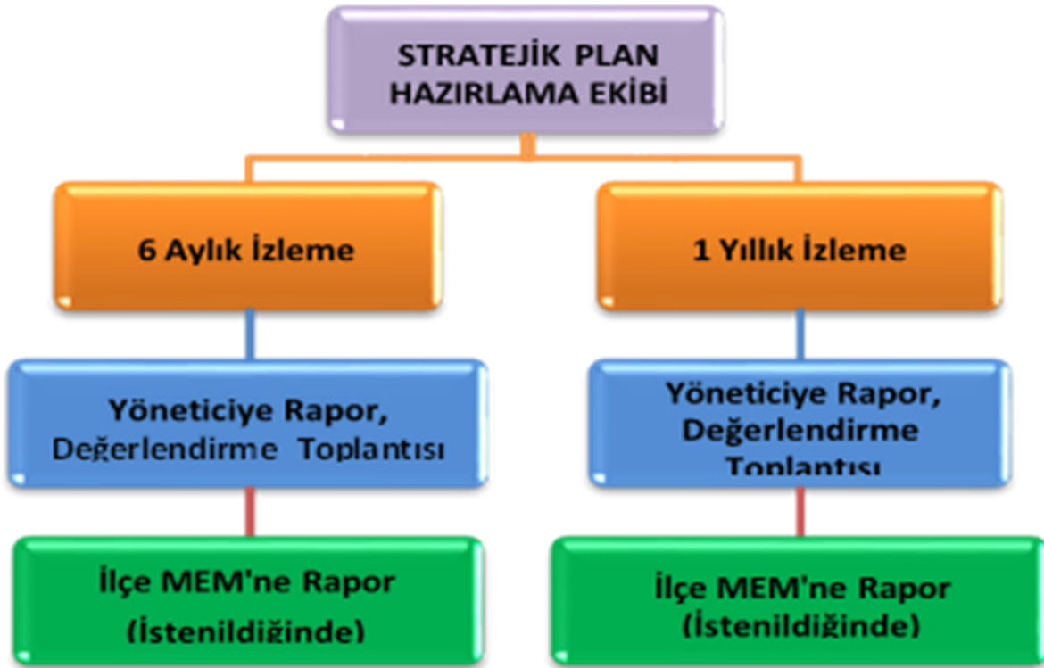
Şekil 3: İzleme ve Değerlendirme Süreci

Müdürlüğümüzün 2024-2028 Stratejik Planı İzleme ve Değerlendirme sürecini ifade eden İzleme ve Değerlendirme Modeli hazırlanmıştır. Müdürlüğümüzün Stratejik Plan İzleme- Değerlendirme çalışmaları eğitim-öğretim yılı çalışma takvimi de dikkate alınarak 6 aylık ve 1 yıllık sürelerde gerçekleştirilecektir. 6 aylık sürelerde rapor hazırlanacak ve değerlendirme toplantısı düzenlenecektir. İzleme-değerlendirme raporu, istenildiğinde İlçe Milli Eğitim Müdürlüğü'ne gönderilecektir. Ayrıca ilçemizin Mülki İdari Amirine sunulacaktır. 1 yıllık izleme-değerlendirme çalışmaları, Stratejik Planımızda yer alan hedeflerin yıllık düzeyde ifade edildiği Performans Programı ve yıl sonunda gerçekleşme düzeylerinin belirlendiği Faaliyet Raporu hazırlanarak yapılacaktır.